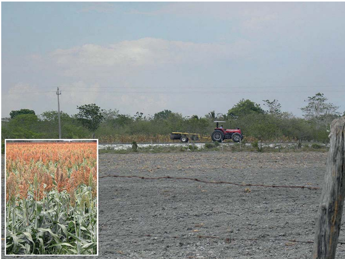
Figura 2. Terreno con agricultura convencional en la comunidad de Vallehermoso, con sorgo en monocultivo.

Producen plátano ( Musa spp. ), que venden en las zonas antes mencionada; y además, poseen siete unidades de riego, con pozos de abastecimiento; donde cultivan maíz, frijol, calabaza, sandía,