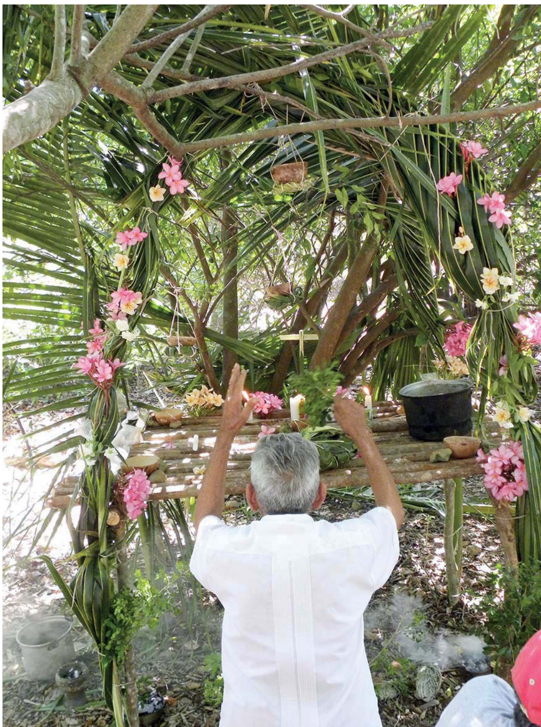
Figura 5. Realización de la ceremonia del cha'a chak , en la zona de agricultura tradicional del sitio de estudio.