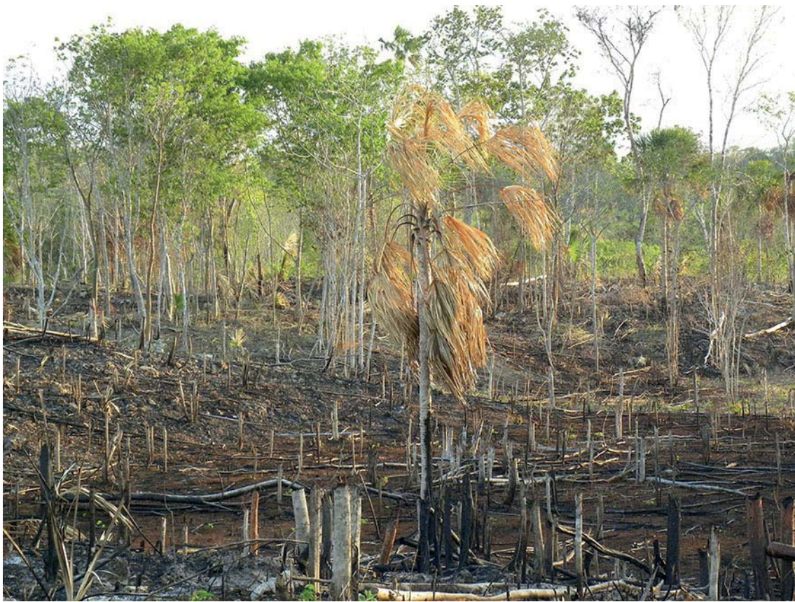
Figura 4. Proceso de roza-tumba-quema (R-T-Q), para milpas, en la zona de agricultura tradicional del sitio de estudio.

El proceso de trabajo que se lleva a cabo en la agricultura tradicional de la zona Maya, incluye: a) selección del terreno; b) “brechado” (caminos de acceso y delimitación de 1 a 1,5m de ancho); c) “roza” (corte de la vegetación baja para determinar el área a utilizar); d) “tumba” (talado de árboles grandes que en la “roza” no se pudieron cortar); e) “quema” (incendio controlado donde se queman todos los residuos de la “roza” y “tumba”); f) siembra (entre mayo y junio); y g) cosecha.