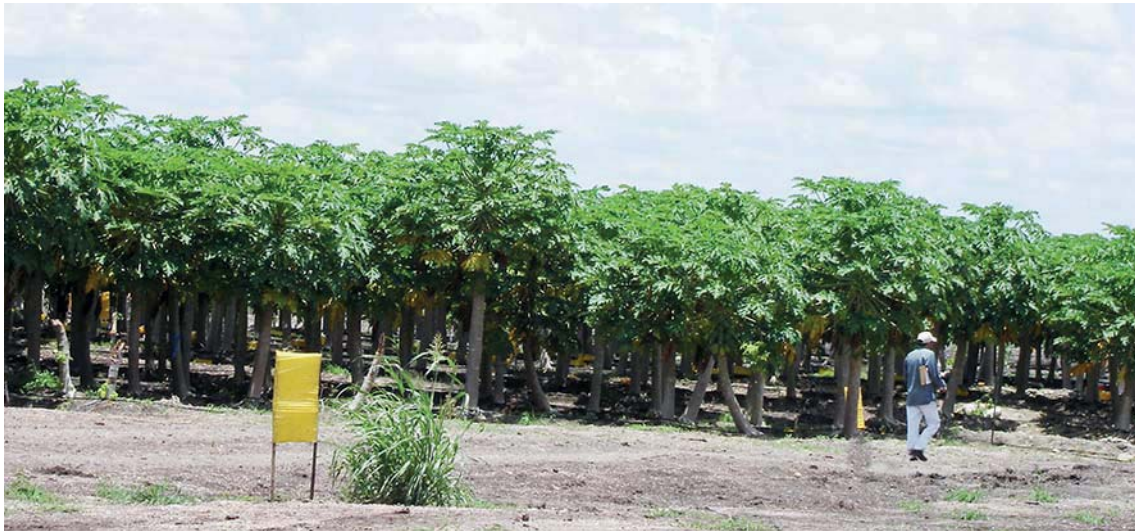
Figura 3. Plantación de papaya “maradol” en la zona de agricultura intermedia, del sitio de estudio.

melón, chile habanero y tomate, en grandes extensiones, como monocultivos, y en cualquier época del año, hacia una agricultura tecnificada.