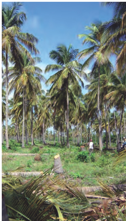
Foto 1. Plantación de coco de 35 años afectada por el Ácaro Rojo ( Raoiella indica Hirst).

El ciclo biológico del Ácaro Rojo desde huevo hasta adulto varía de 23 a 28 días en las hembras y de 20 a 22 días en los machos, sus poblaciones se incrementan en condiciones de alta temperatura y prolongada luz solar (Nageshachandra y Channabasavanna 1984; Rodríguez et al. , 2007).