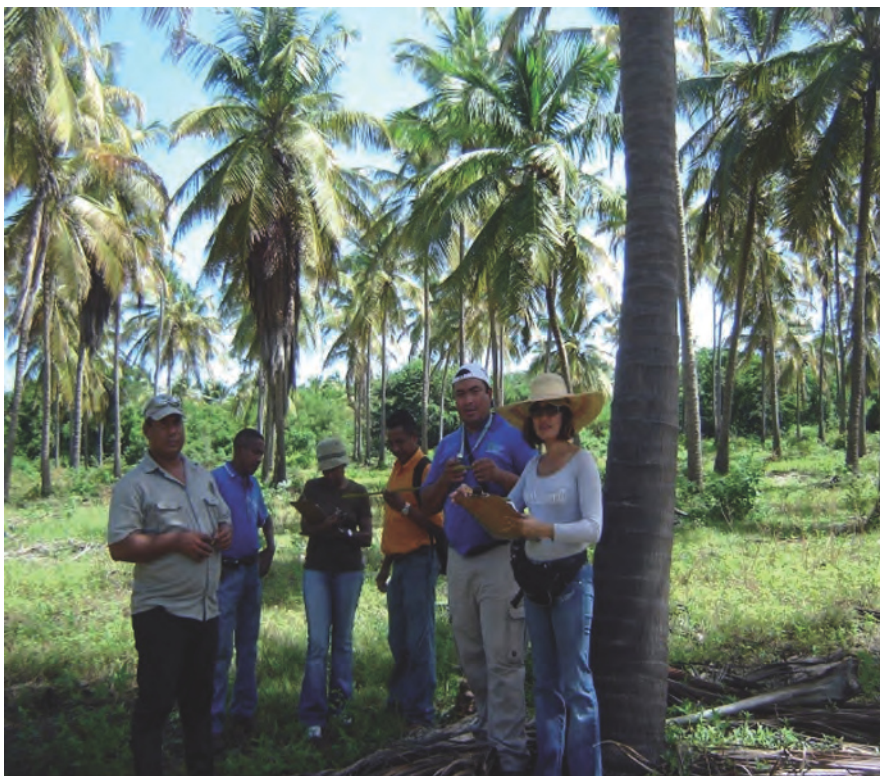
Foto 2. Productores, obreros, representantes de ASOCOCO, funcionarios de diferentes instituciones del MPPAT y asesores cubanos.

2. De cada planta se tomaron 2 hojas basales, con ubicación alterna y de cada hoja fueron seleccionados 6 folíolos (2 apical, 2 medios y 2 basal), de cada folíolo