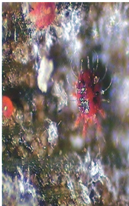
Foto 4. Observación y colecta de poblaciones del Ácaro Rojo.

Es importante considerar que el número de plantas a seleccionar por fincas o parcelas puede aumentar de acuerdo al estudio que se quiera hacer sobre el ácaro. La selección de las hojas puede ubicarse según los puntos cardinales. Los trozos de folíolos de 10 centímetros. pueden ser colocados individualmente en bolsas con cierre, previamente rotuladas para luego ser procesadas en el laboratorio con la ayuda de microscopios estereoscópico (Foto 4).