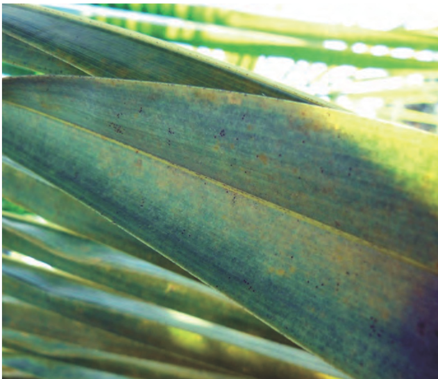
Foto 3. Poblaciones de ácaro rojo en folíolos de coco.