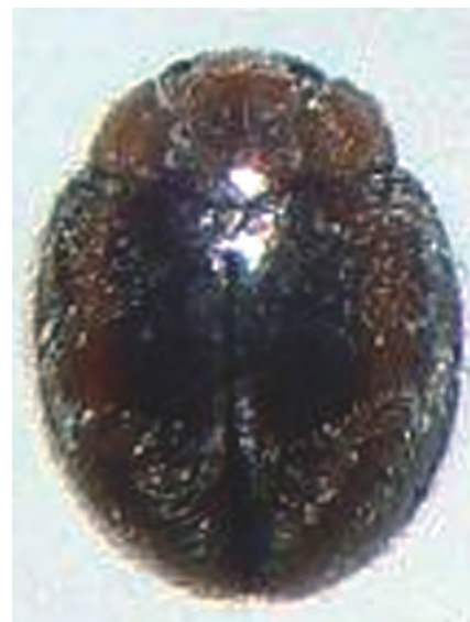
Foto 7. Coquito o mariquita depredadora, perteneciente al género Scymnus Familia Coccinellidae y Orden Coleoptera.

Por lo antes expuesto, el INIA actualmente está proponiendo proyectos productivos de investigación y extensión en el rubro coco donde se involucran las comunidades productoras de coco y las instituciones a fin de buscar alternativas de control al Ácaro Rojo del cocotero R. indica .