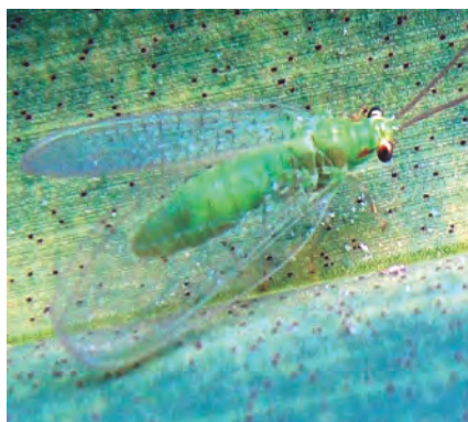
Foto 6. Depredando el Ácaro Rojo, adulto de la familia Chrysopidae.