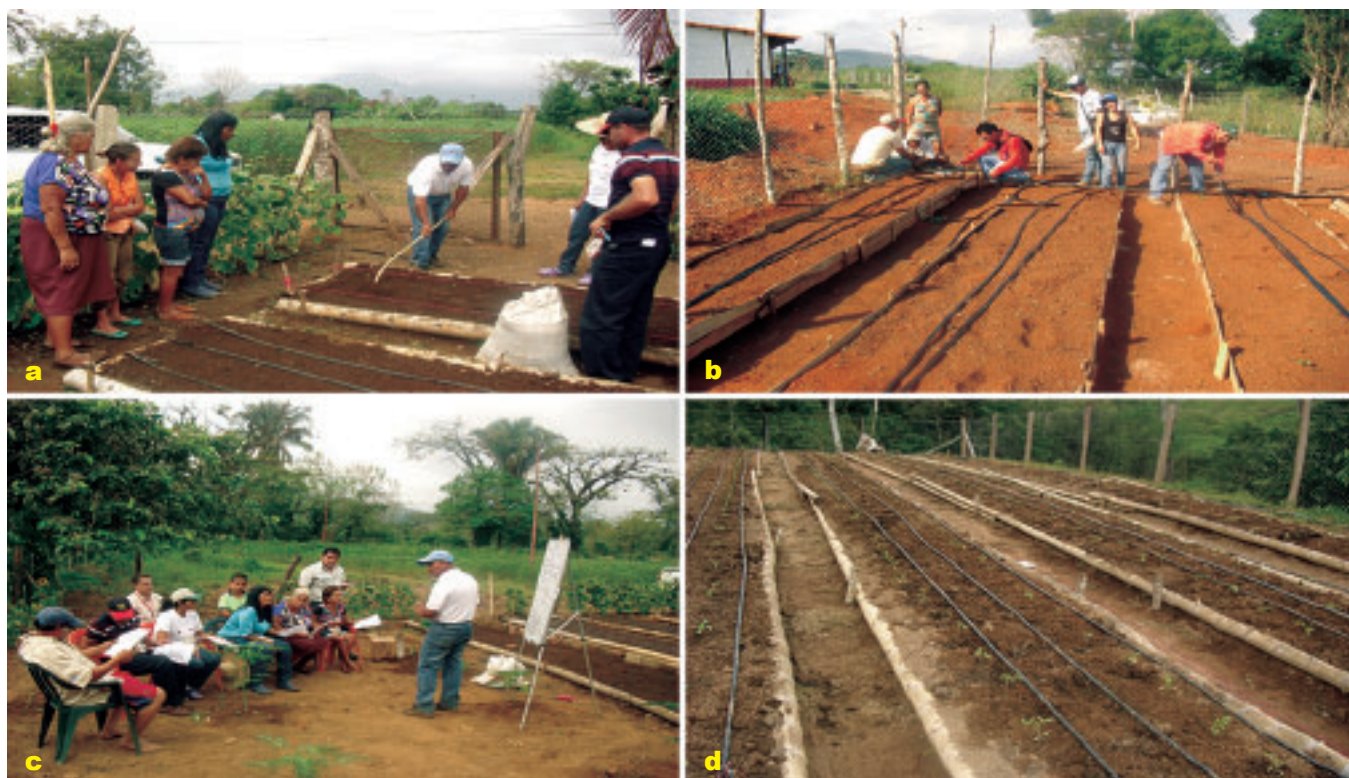
Foto 8 a, b, c y d. Formación en trazado, siembra y manejo eficiente de riego.