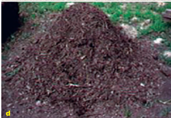
Foto 2 a, b, c y d. Preparación de compost, técnica bocashi e incorporación de materia orgánica.

El huerto familiar contó con una dimensión de 200 metros cuadrados (10 m x 20 m), cercados con malla de gallinero y estantes de madera, distribuidos en 5 canteros con dimensiones de 20 * 1,2 * 0,20 m, caminerías de 0,5 metros entre canteros y caminerías laterales, guarderas de madera, guafa u otro elemento local, (Foto 3 a, b y c), con 3 hileras de cinta de riego por goteo, (Figura), suministrando agua almacenada en un tanque de 2.000 litros elevado en un pedestal de concreto,