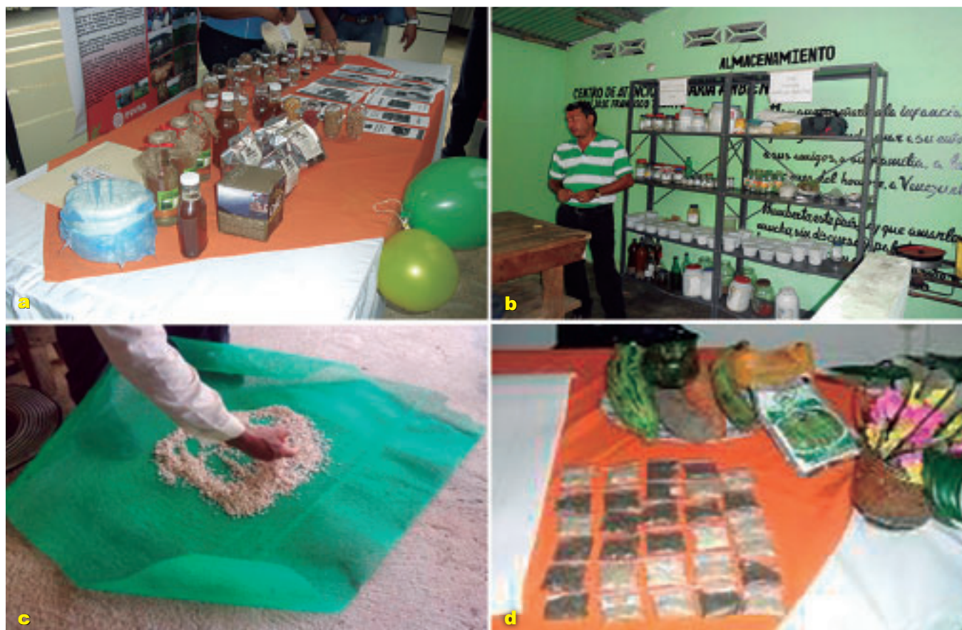
Foto 7 a, b, c y d. Trabajos de procesamiento y conservación artesanal de semillas.