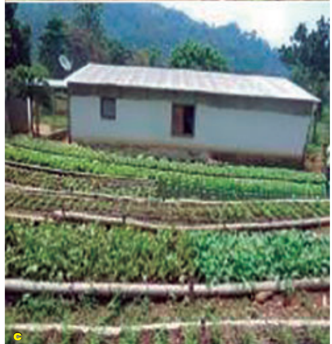
Foto 4 a, b y c. Especies de hortalizas sembradas.