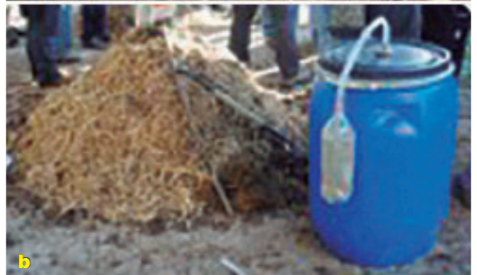
Recipiente de 4 kilogramos (Pote plástico con tapa) y botella reciclada de refresco, 1 litro de leche, 1 litro de melaza, 2 kilogramos de tierra compostero o tierra de bosque, 1 kilogramo de fororo (maíz molido o yuca molida) 50 centímetros de manguera de 3/8".