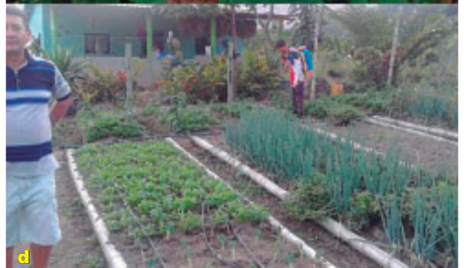
Foto 6 a, b, c y d. Uso de barreras repelentes y atrayentes, biofertilizantes y trampas de colores.