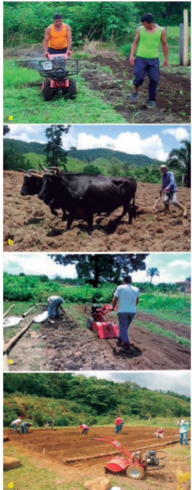
Foto 1 a, b, c y d. Preparación del terreno para levantar canteros.

Se escogió el terreno, limpió y preparó el sustrato, (Foto 1 a, b, c y d). El terreno fue labrado y se preparó el sustrato con tierra negra, bosta, humus sólido, arena u otro material de la zona en proporciones de 65% de materia orgánica y 25% de capa vegetal, previamente desinfectado con la incorporación de Trichoderma o un baño con agua hirviendo, (Foto 2 a, b, c y d).