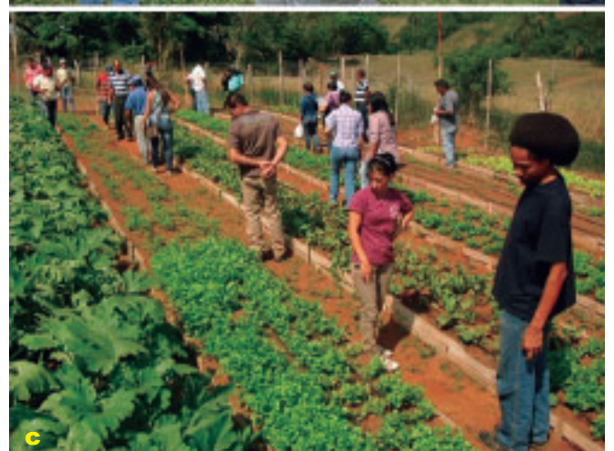
Foto 10 a, b y c. Talleres motivacionales sobre desarrollo local sustentable con procesos agrícolas agroecológicos.