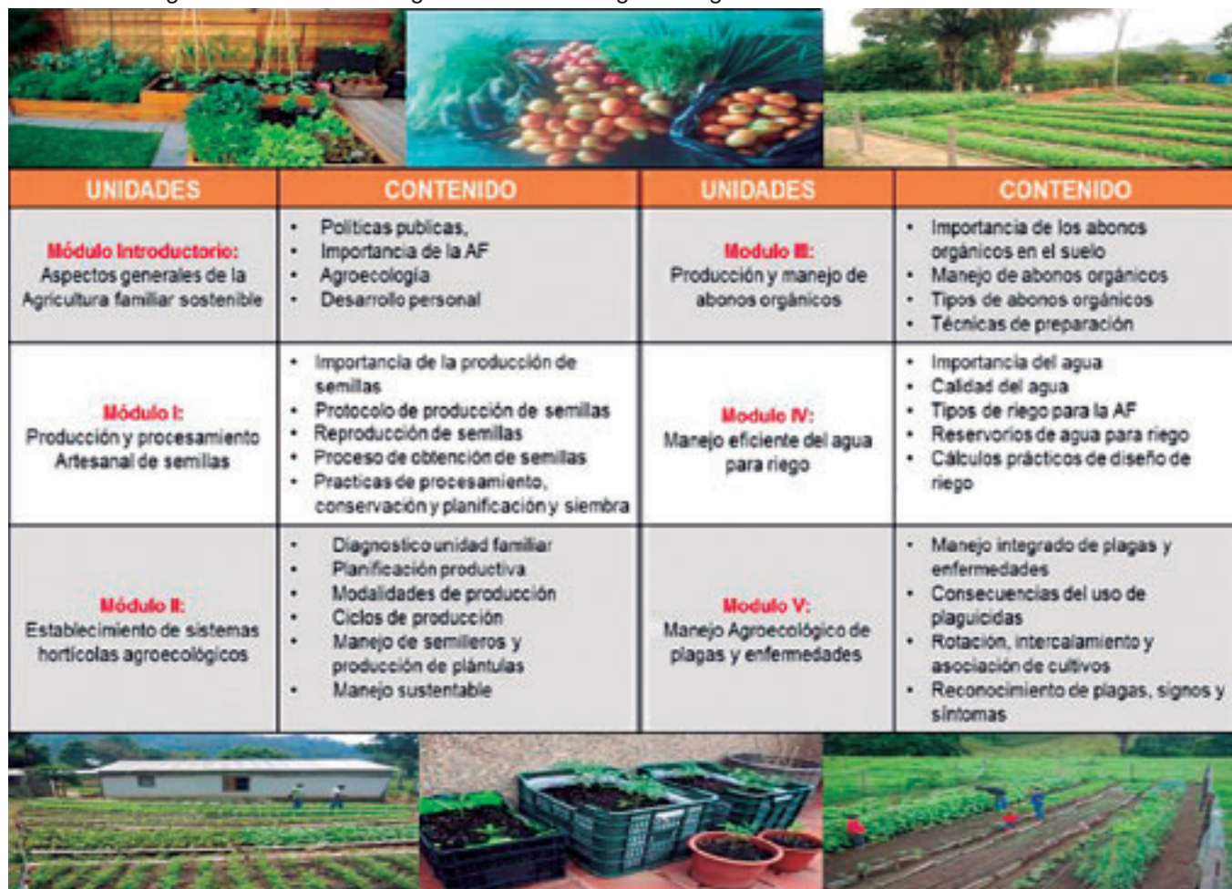
Cuadro 4. Programa de formación: Agricultura familiar agroecológica.

Así mismo, el fortalecimiento de capacidades técnicas se complementó con métodos formativos para realzar la importancia del ser como eje fundamental en los procesos agroecológicos, para ello, se realizaron talleres motivacionales (Foto 10 a, b y c) con la finalidad de potenciar el crecimiento personal, autoestima y desarrollo humano, así como socio-política; todo ello con la finalidad de tener actores locales proactivos, con conciencia y participantes activos en los procesos locales de desarrollo.