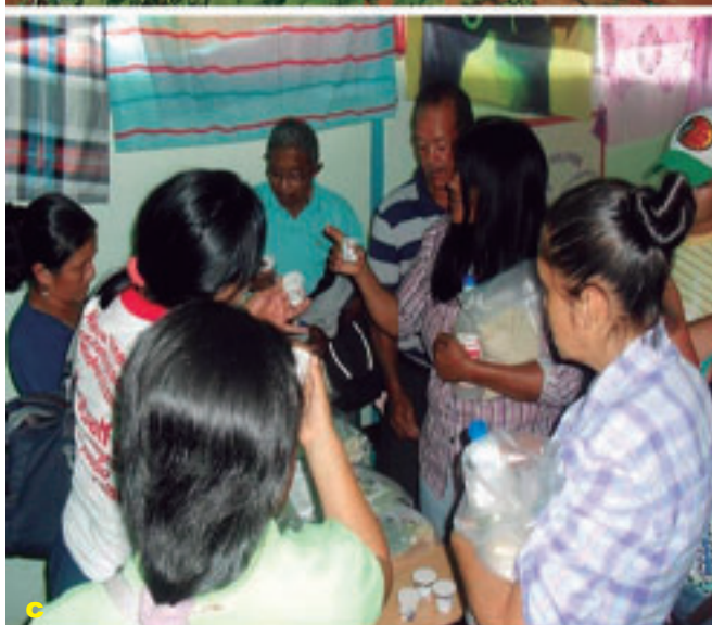
Foto 9 a, b y c. Gira técnica sobre preparación de biofermentos, manejo integrado de plagas y uso de biocontroladores.