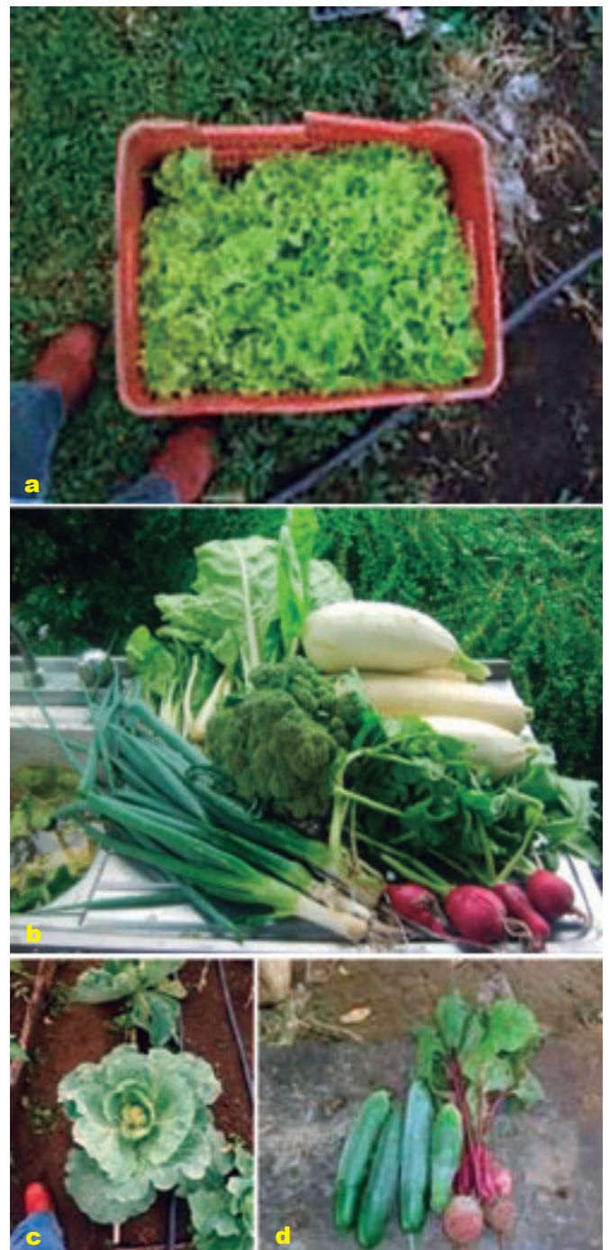
Foto 11 a, b, c y d. Productos obtenidos de las huertas agroecológicamente.

Sheider S. 2015. Agricultura familiar y las estrategias de desarrollo rural territorial. Aspectos conceptuales de la agricultura familiar en América Latina – antecedentes, definición y desarrollo. Universidad Federal de Rio grande do Sul/Brasil. IICA. San José, Costa Rica. 23 p.