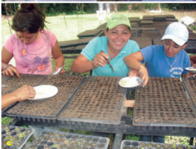
Foto 5 a, b y c. Siembra en canteros de variedades de hortalizas; llenado, siembra y producción de plántulas en bandejas.