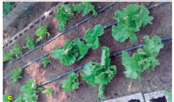
Foto 3 a, b y c. Trazado, distribución de canteros, guarderas laterales, cercado y cinta de riego.