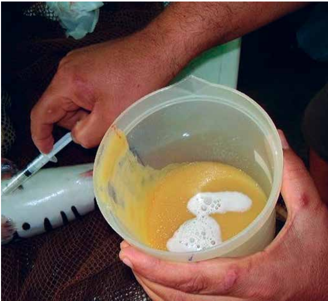
Foto 5. Descarga del semen colectado sobre los ovocitos.

Con una pluma de ave, se mezclaron los productos sexuales por dos minutos e inmediatamente, se añadió una pequeña cantidad de agua para hidratar y facilitar la activación de los espermatozoides y la apertura del micrópilo del óvulo (Fotos 6 y 7).