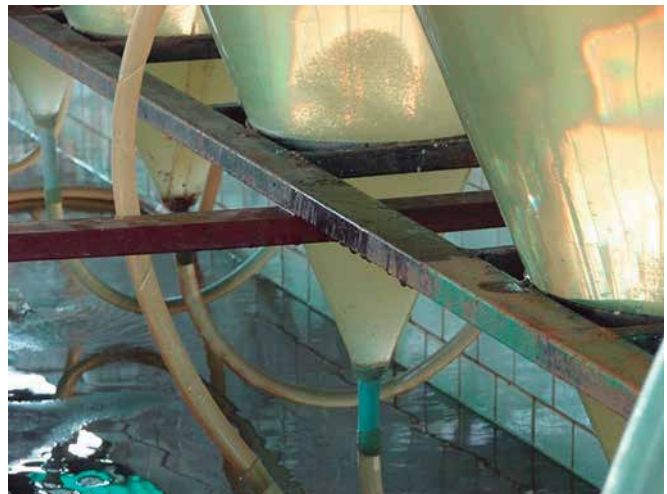
Foto 8. Incubación de la masa de huevos de bagre rayao.