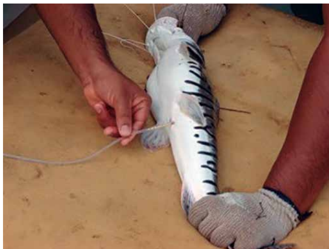
Foto 2 Biopsia ovárica en hembras empleando una cánula plástica.

El fluido seminal se vertió sobre los óvulos ya contenidos en una vasija plástica limpia y seca (Foto 5).