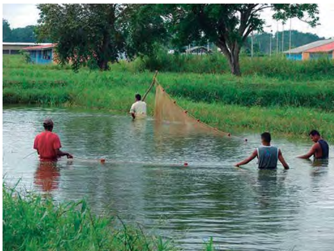
Foto 1. Muestreo para la selección de reproductores con signos de madurez sexual.

Los reproductores seleccionados con un peso promedio 2,20 kilogramos se ubicaron en un tanque de concreto de 5,6 metros cúbicos de capacidad, a una relación de una hembra y dos machos, para asegurar la disponibilidad de semen. Se pesaron cada uno de los animales, a fin de calcular la dosis total del agente hormonal (hipófisis de carpa y Gonadotropina coriónica humana) a aplicar a cada uno.