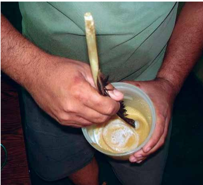
Foto 6. Mezclado de los ovocitos y semen empleando una pluma de ave.

El desarrollo de los embriones se realizó en incubadoras acrílicas tipo agrover con volumen de 60 litros, la cual operó con flujo de agua ascendente y continuo.