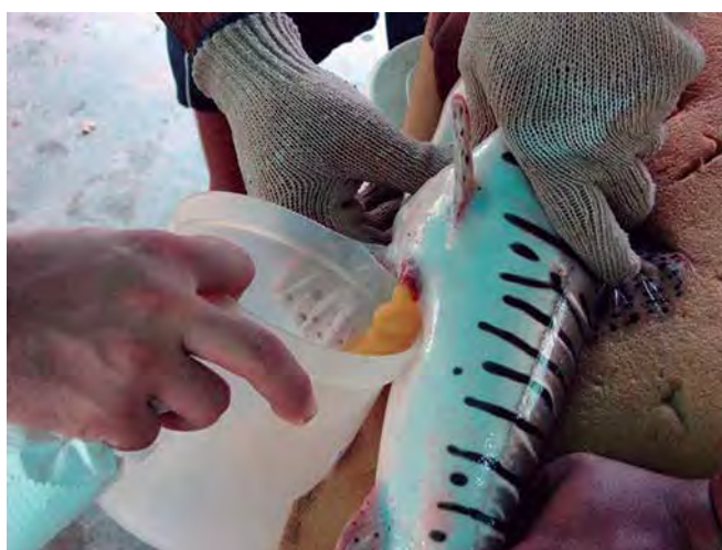
Foto 3. Extracción de ovocitos en las hembras