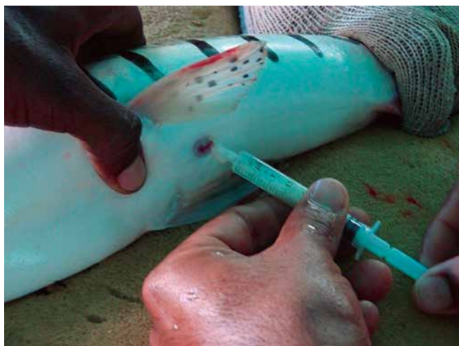
Foto 4. Recolección con jeringa plástica del fluido seminal eyaculado.