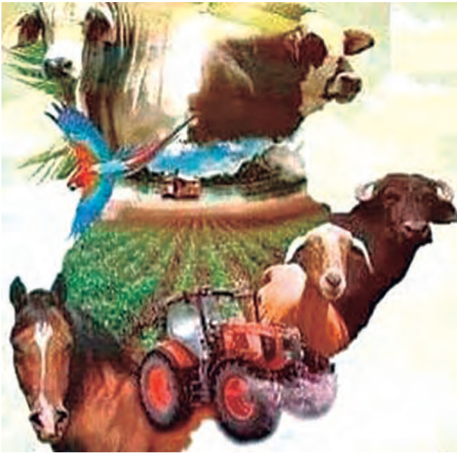
Figura 1. Logo del Consejo Campesino Pedro María Ureña.

El modelo reflejó la ampliación de los derechos de los productores que hacen vida en la organización, logrando obtener el financiamiento para pequeños y medianos productores por parte de Fondo para el Desarrollo Agrario Socialista (FONDAS) y Banco Agrícola de Venezuela (BAV), regularización del 89% de las tierras existente en la comunidad, a través del Instituto Nacional de Tierras (INTI), fortalecimiento de los sistemas de riego mediante el Instituto Nacional de Desarrollo Rural (INDER), y asesoramiento técnico integral por parte del INIA Táchira, Foto 5.