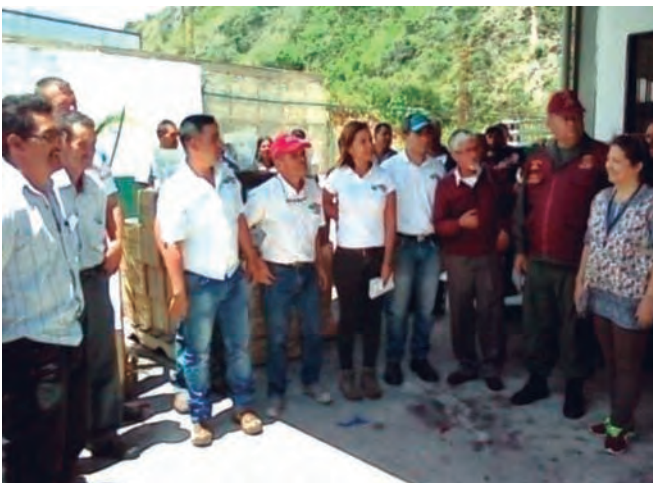
Foto 5. Instituciones participantes en el reconocimiento público del Consejo de Productores del estado Táchira.

El modelo reflejó la ampliación de los derechos de los productores que hacen vida en la organización, logrando obtener el financiamiento para pequeños y medianos productores por parte de Fondo para el Desarrollo Agrario Socialista (FONDAS) y Banco Agrícola de Venezuela (BAV), regularización del 89% de las tierras existente en la comunidad, a través del Instituto Nacional de Tierras (INTI), fortalecimiento de los sistemas de riego mediante el Instituto Nacional de Desarrollo Rural (INDER), y asesoramiento técnico integral por parte del INIA Táchira, Foto 5.