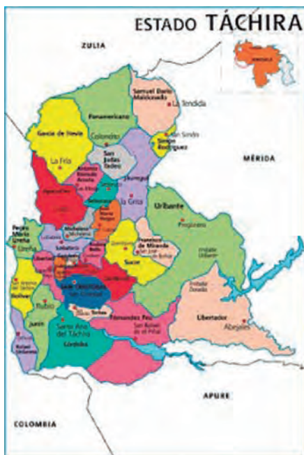
Figura 2. Mapa territorial del estado Táchira.