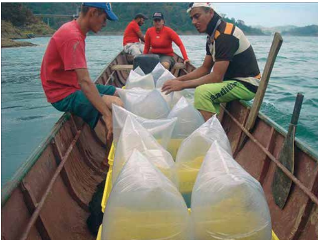
Foto 7. Durante el transporte de los alevines para la siembra.