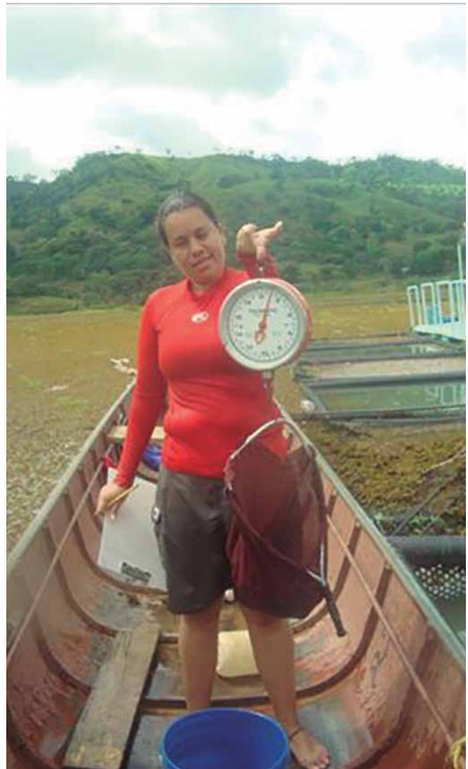
Foto 8. Pesando las cachazas.