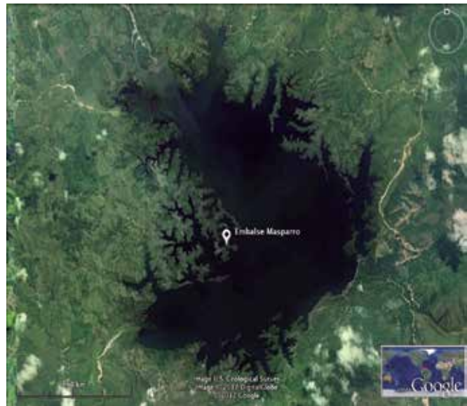
Foto 1. Embalse Manuel Palacio Fajardo (Masparro), estado Barinas, vista satelital.

El estudio en ambos embalses consistió en obtener tanto información concerniente a la calidad de agua, como el que se registró en el embalse Masparro (Cuadro1), donde se pudo apreciar que en general, los valores están dentro de los adecuados para el cultivo de peces, así como también la recolección de especies ícticas (peces), y de planctón, para la valoración y diagnóstico de su potencial pesquero. Esto servirá en la programación de posibles planes de carácter público para realizar en este embalse, siembras controladas y engorde de peces.