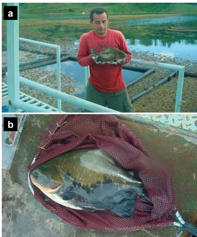
Foto 3 a y b. Muestra cachama cosechada en jaula de la ACAV.