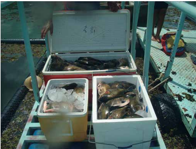
Foto 6. Conservación de cachazas recién cosechadas.