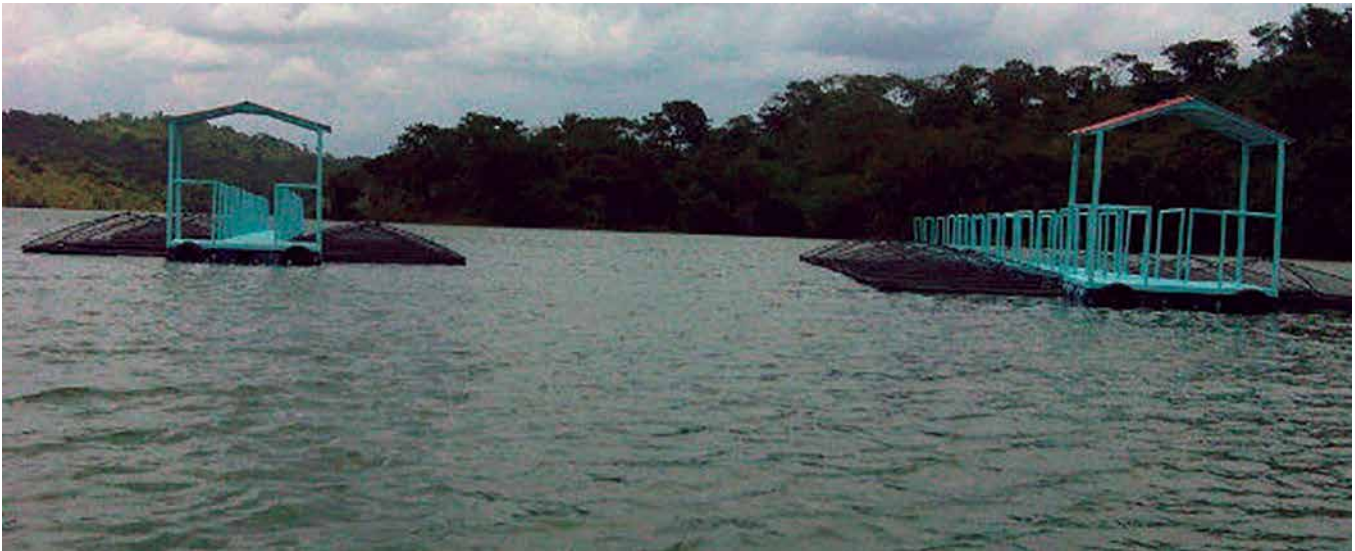
Foto 5. Jaulas flotantes de la ACAV para el engorde de cachamas en el embalse Boconó.