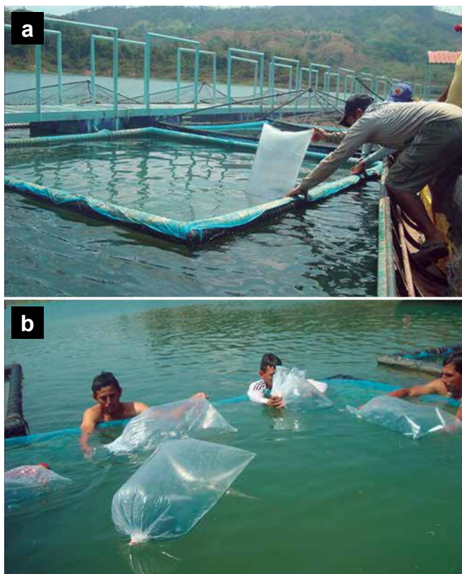
Foto 4 a y b. Durante la siembra de alevines en jaulas ACAV.