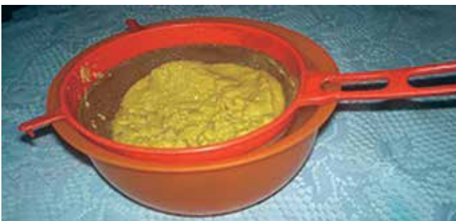
Foto 7. Colado de la pulpa del caujiil.

Clarificación: obtenido el jugo (Foto 8) se procedió a clarificarlo espolvoreando 1 gramo de gelatina comercial sin sabor, a temperatura ambiente, la mezcla fue agitada, para luego dejar reposar por espacio de 15 minutos hasta ver coagulación en la superficie del líquido. Una vez clarificado el jugo se procedió al filtrado en un colador de tela de algodón tipo gasa (Foto 9).