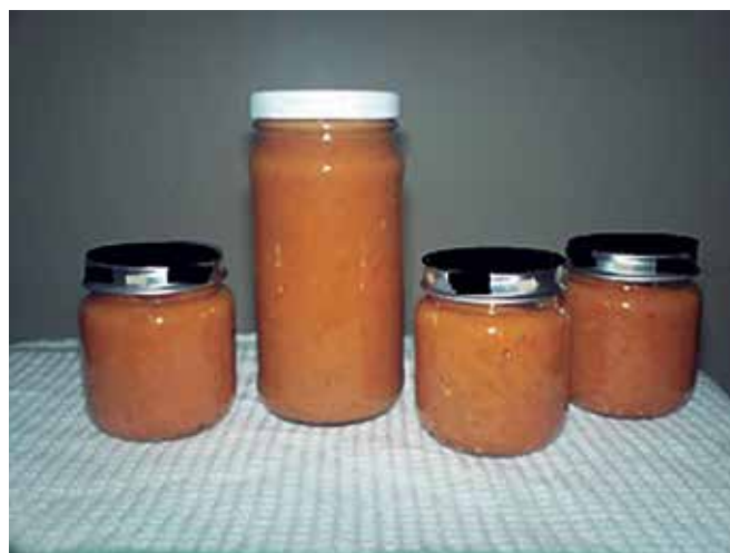
Foto 12. Mermelada de cauji envasada.