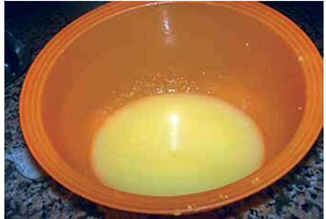
Foto 8. Jugo colado del pseudofruto de caujiil.

Clarificación: obtenido el jugo (Foto 8) se procedió a clarificarlo espolvoreando 1 gramo de gelatina comercial sin sabor, a temperatura ambiente, la mezcla fue agitada, para luego dejar reposar por espacio de 15 minutos hasta ver coagulación en la superficie del líquido. Una vez clarificado el jugo se procedió al filtrado en un colador de tela de algodón tipo gasa (Foto 9).