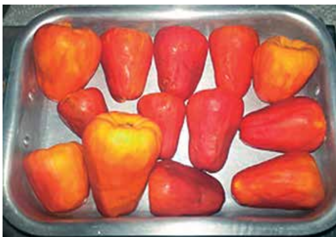
Foto 3. Pseudofrutos de caujiil lavados, listos para procesar.

En el Cuadro 1 se muestran los datos obtenidos de los pesos correspondientes de la materia prima en el momento de la recepción en el laboratorio con y sin la nuez (Foto 3), para luego ser refrigerados y aplicarles los análisis físico-químicos correspondientes. La cantidad de pseudofrutos recolectados fueron de 15,2 de los cuales se utilizaron para determinarles humedad. Los datos de la pesada de los 13 pseudofrutos de caujiil a procesar están en el Cuadro 1, y en la Foto 4 se observa el procedimiento de pesada.