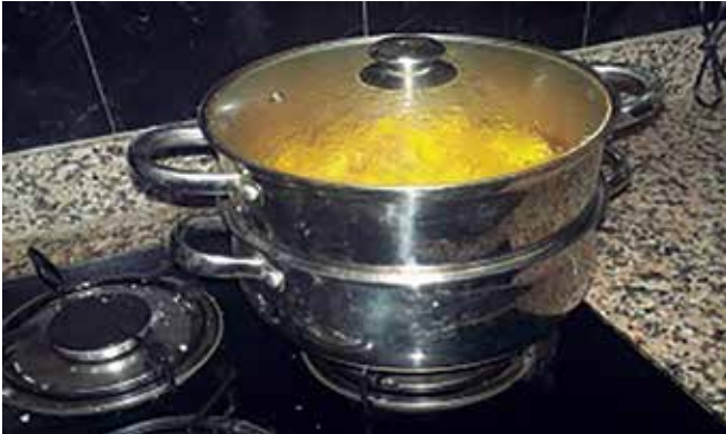
Foto 5. Escaldado de la fruta cortada.

Preparación preliminar: los pseudofrutos de caujiil previamente lavados con agua clorada se cortaron en pedazos pequeños con cuchillo de acero inoxidable esterilizado. Se escaldaron a vapor (95°C) de 5 a 8 minutos (Foto 5) y luego se procedió a licuarlos, utilizando una licuadora de alta revolución (Foto 6). El jugo obtenido se filtró utilizando un colador con malla plástica, para separar partículas de cáscara y fibra del caujiil (Foto 7).