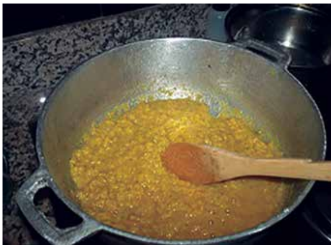
Foto 10. Cocción de la mermelada.

das anteriormente, se llevó a ebullición y se adicionó el azúcar lentamente, luego el ácido cítrico y finalmente gelatina comercial sin sabor. Ésta última se mezcló bien con un tercio del azúcar (A), y se agregó lentamente mientras se agitaba la mermelada. Se dieron 5 minutos más de calentamiento hasta que se alcanzaron los 65 °Brix. En este punto se retiró la olla de la fuente de calor y tomó una muestra de la mermelada. Se enfrió hasta 25 °C, procediendo a medir el pH para constatar que estaba entre 3,0 y 3,5. Finalmente, pesó la mermelada obtenida. Esta etapa duró de 30 a 40 minutos aproximadamente (Foto 10).