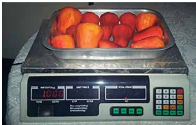
Foto 4. Pesada de los pseudofrutos de caujiil a procesar.

Se siguió el procedimiento sugerido por CODEX Alimentarius (2004), a excepción de del tiempo de cocción, el cual fue menor para el pseudofruto del caujiil debido a que un tiempo más prolongado al planteado en este procedimiento, produce una deshidratación excesiva de la pulpa y oscurecimiento debido a la oxidación (un diagrama de flujo del procedimiento, puede apreciarse en la Figura 1).