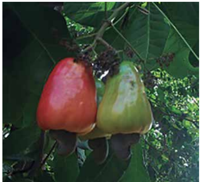
Foto 2. Frutos sin daño físico, con un adecuado estado de madurez (izquierda) y sin adecuado estado de madurez para este estudio (derecha).

dróxido de sodio en presencia de fenolftaleína como indicador. Los resultados se expresaron en gramos del ácido predominante en la fruta en 100 gramos de producto (COVENIN, 1977).