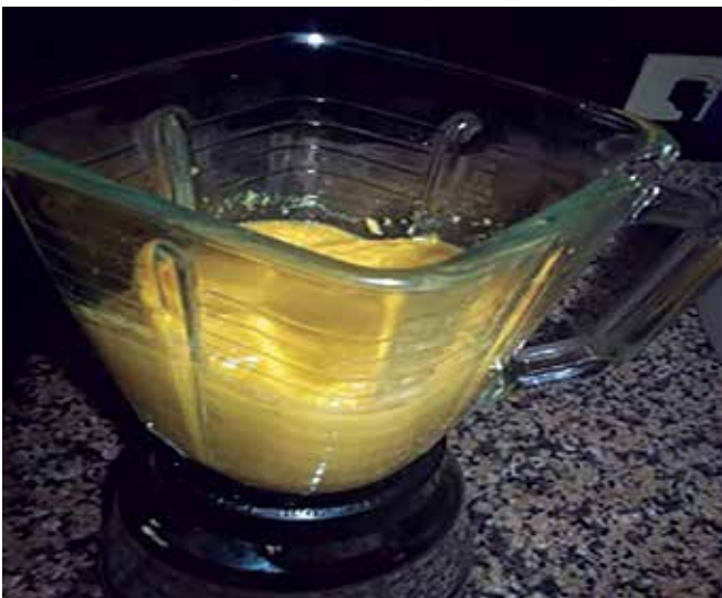
Foto 6. Licuado de la pulpa del pseudofruto de caujiil.