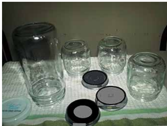
Foto 11. Envases esterilizados para adicionar la mermelada de cauji.

Etiquetado: las etiquetas se pegaron cuando los envases estuvieron a temperatura ambiente y se verificara la gelificación de la mermelada tal como lo indica la norma COVENIN, 1989.