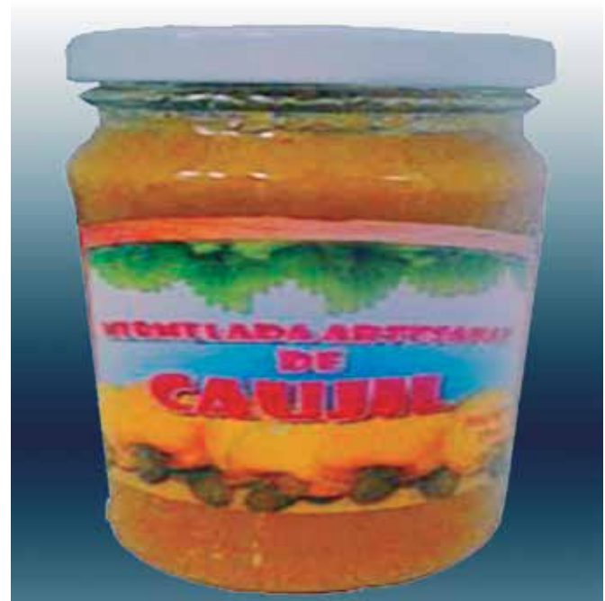
Foto 13. Presentación de la mermelada artesanal de caujiil.

La Foto 13 muestra la presentación de la mermelada en el frasco de vidrio etiquetado con una capacidad de 370 gramos. Presenta un color naranja parduzco brillante, por efecto de la oxidación durante el cocimiento en paila al aire libre y al tiempo que tardó expuesta la misma. Tendrá un tiempo de almacenamiento de 1 año aproximadamente en ambiente fresco y oscuro.