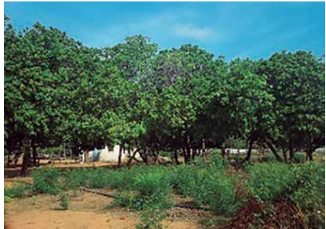
Foto 1. Árboles de cauji en el lugar de recolección de los pseudofrutos (comunidad Las Mercedes, parroquia San Isidro, estado Zulia).

Determinación de la acidez titulable (AT): la muestra se tituló con una solución alcalina de hi-