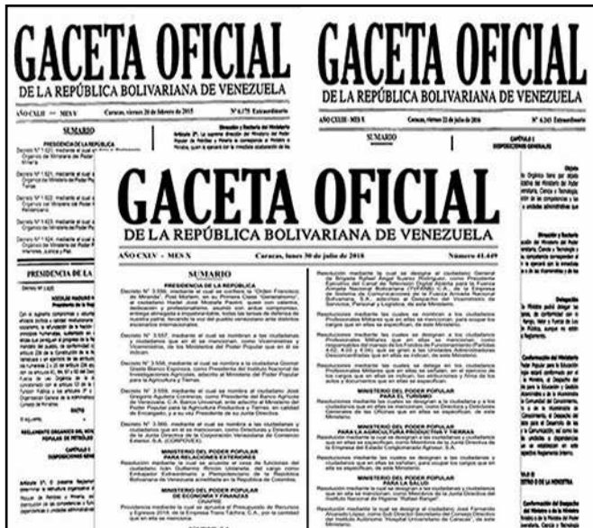
Figura 3. Soporte legal de la evolución del sector zootécnico.

A pesar de las tres reestructuraciones este viceministerio ha mantenido la Dirección General de Especies Mayores, responsable de los rubros vacunos, ovinos, caprinos y bufalino, y la Dirección General de Especies Menores responsable de los rubros porcino, aves, conejos, abejas y las Plantas de Alimentos Balanceados para Animales (ABA).