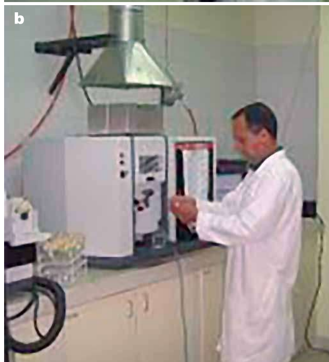
Foto 2 a y b. Ejecución de análisis de muestras de suelo en el laboratorio.