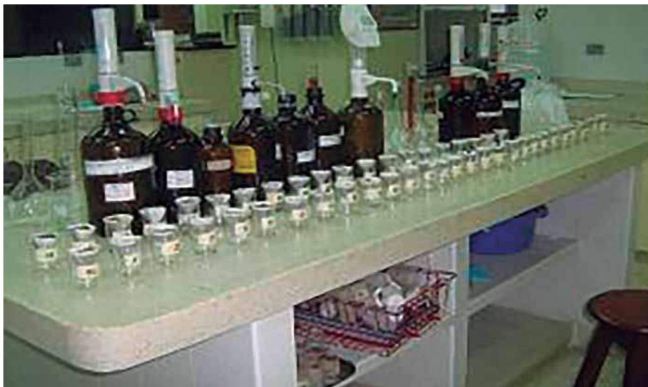
Foto 1. Laboratorio de Suelos INIA Mérida.

Entre los servicios que ofrece el INIA Mérida, está el de análisis fisicoquímico de muestras de suelo con fines de fertilidad y enmiendas, a través del laboratorio (Foto 1), ofreciendo además, una caracterización de las propiedades físico-químicas del terreno de donde proviene la muestra. De esta manera, se da a conocer la fertilidad del suelo objeto de estudio, a través de la evaluación de la disponibilidad de los elementos nutritivos presentes en el mismo, por medio de un informe de resultados y recomendaciones emitido por este laboratorio al usuario.