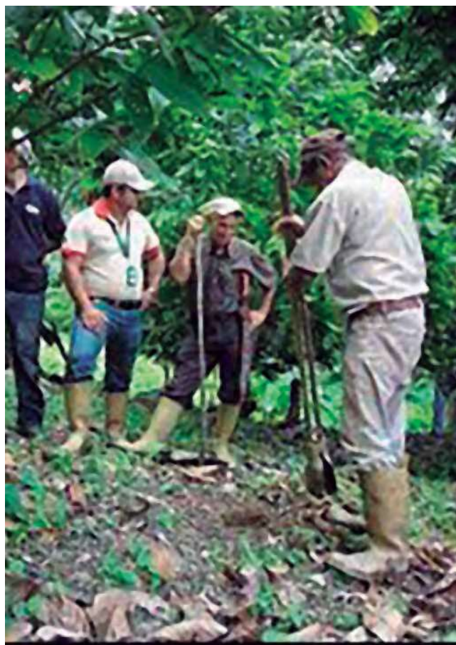
Foto 3. Toma de muestras de suelo en una plantación de cacao.

les que las plantas necesitan para su desarrollo y producción. Desde este punto de vista, el análisis de fertilidad suministra información muy valiosa al productor guiándolo en el uso eficiente y racional de fertilizantes y enmiendas, manejo adecuado de suelos a través de una interpretación práctica de los resultados obtenidos para aplicarlos en la producción.