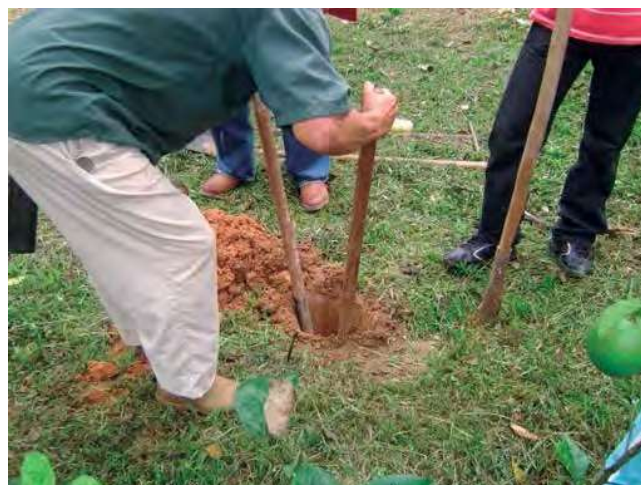
Foto 5. Toma de muestras de suelo con fines de fertilidad.

Es importante realizar toma de muestras de suelo con fines fitopatológicos y de fertilidad por lo menos dos meses antes de sembrar, pues de esta manera se puede conocer a tiempo los resultados de los análisis referentes al pH, macro y micro elementos, materia orgánica y conductividad eléctrica, así como datos físicos de textura y estructura del suelo para realizar las correcciones necesarias durante la preparación del terreno y tomar las precauciones en caso de presentar algún patógeno asociado al cultivo. Fotos 5 y 6.