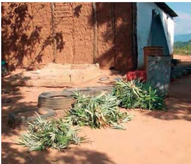
Foto 2. Clasificación por tamaño.