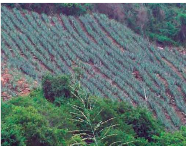
Foto 7. Diseño de plantación proporcional a la pendiente causante de graves daños de erosión al suelo.

En el estado Trujillo la siembra de piña se desarrolla en terrenos inclinados de moderada a fuertes pendientes, usándose en su gran mayoría diseños de plantación a favor de esta, lo que ha causado graves daños de erosión al suelo, que obligan al productor a seguir interviniendo nuevas áreas para sembrar. En vista de esta situación se recomienda la utilización de diseños de plantaciones que corrijan efectos de erosión como es el caso de las Curvas de Nivel con tresbolillo, las cuales consisten en sembrar cada semilla por hilera a una misma altura o nivel con respecto a la siguiente, para ello se utiliza una herramienta denominada y conocida comúnmente como caballete. Fotos 7, 8, 9 a y b.