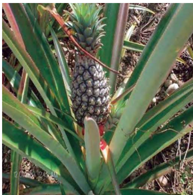
Foto 1. Selección de semilla sana.

Esta es una de las prácticas más importantes, ya que, de ella depende el éxito en la producción; principalmente se debe realizar selección de plantas madres sanas, con buen vigor, libres de enfermedades y plagas; asimismo se recomienda clasificar la semilla por tamaños y establecer lotes de siembra para obtener homogeneidad en la plantación, facilitar su manejo y cosechar lotes completos. Una vez realizada esta práctica, se recomienda la desinfección usando productos que aseguren su efectividad contra enfermedades y plagas importantes, como es el caso de la Cochinilla de la piña Dysmicoccus brevipes . Fotos 1, 2 y 3.