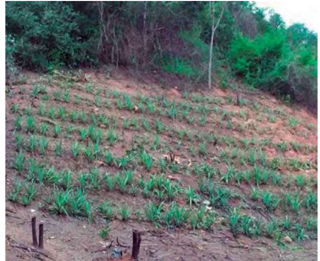
Foto 8. Diseño de plantación en curvas de nivel para evitar erosión en suelo.