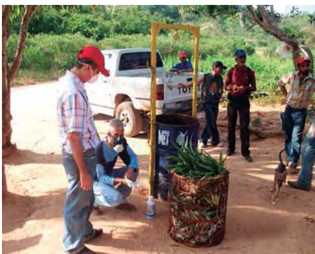
Foto 3. Desinfección de hijos o semilla asexual de piña.