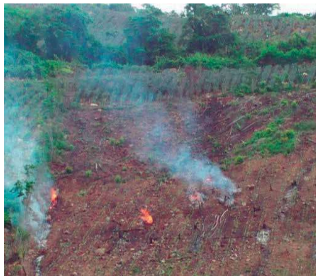
Foto 4. Quema de restos de cosecha por productores en áreas estratégicas.