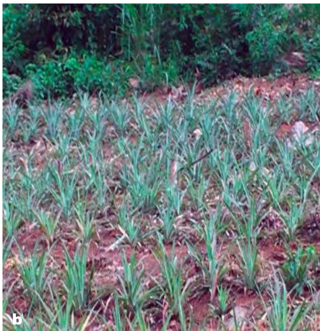
Foto 10 a y b. Sistema de siembra en hileras sencillas.

Hileras dobles o método tecnificado: consiste en sembrar cada hijo o semilla asexual de piña a distancias de 1,50 a 2 metros en hilera, 40-60 centímetros entre planta y 40-60 centímetros entre doble hilera. Fotos 11 a y b.