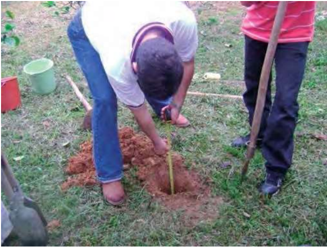
Foto 6. Medición de profundidad de muestreo.