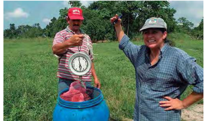
Foto 2. Pesaje de yuca en agua.