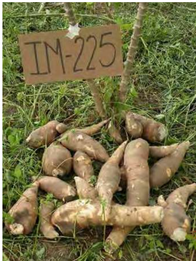
Foto 6. Clon IM225.

El porcentaje de materia seca fue superior a 30% (condición importante para la agroindustria por su relación con el contenido de almidón), en 13 de los 17 clones evaluados, lo que indica que pueden ser utilizados para obtención de almidón. El clon 18 obtuvo los mejores valores de %MS (Figura 2).