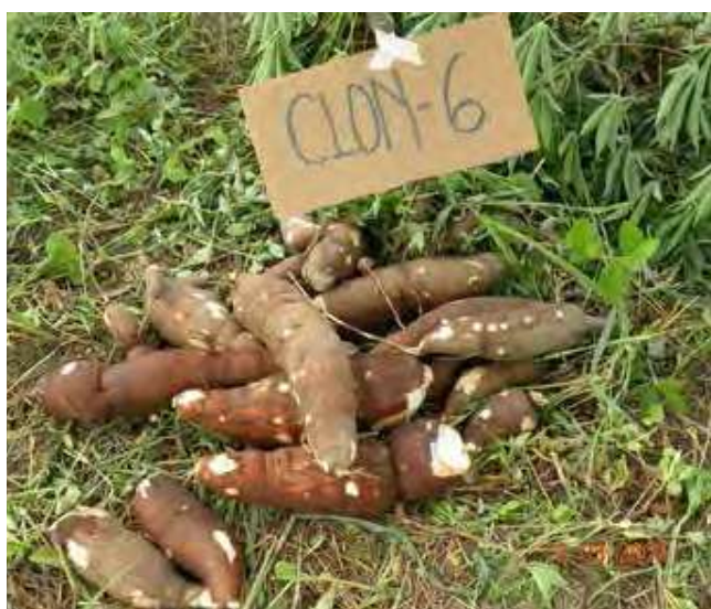
Foto 5. Clon 6.