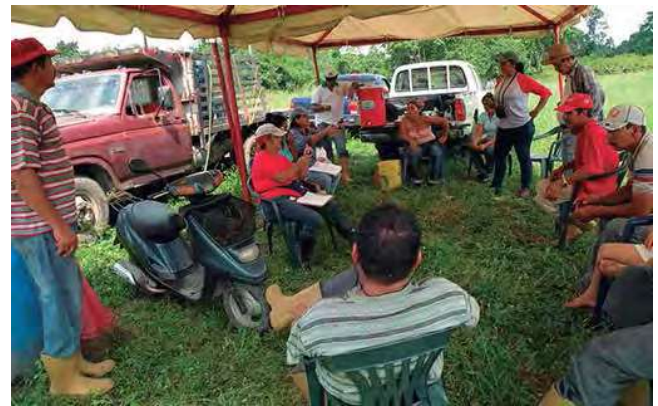
Foto 3. Discusión participativa de los resultados obtenidos.