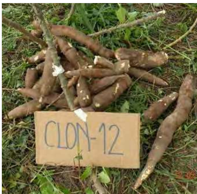
Foto 4. Clon 12.

Para los productores, los mejores clones dulces fueron: clon 12 (60 puntos), clon 6 (58 puntos; Fotos 4 y 5) y los mejores clones amargos fueron: Clon IM225 (59 puntos; Foto 6) y Paiguanera. Lo cual coincide con la evaluación técnica realizada paralela a la participativa. También se procedió a hacer un estudio de degustación (con los mejores clones dulces) para conocer que uso culinario es el adecuado para cada uno. El clon 6 es ideal para fritura por ser más fibroso, el clon 12 es más suave bueno para comer la yuca sancochada.