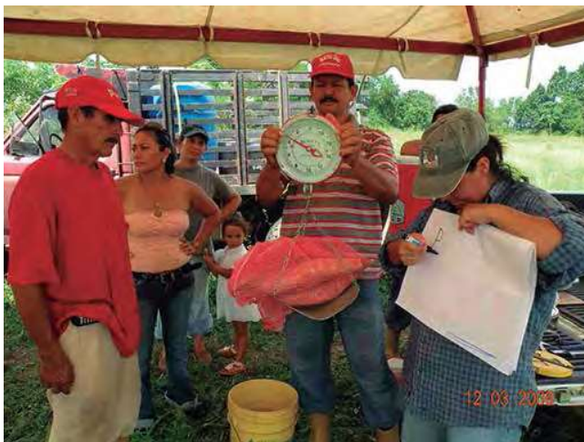
Foto 1. Pesaje de yuca en al aire.

Se seleccionaron 5 productores dentro del grupo que participó en la cosecha, los mismos asignaron puntuación de 0 a 3 para las categorías: rendimiento, aspecto de las raíces, porte de la planta, resistencia a plagas y enfermedades. Se sumó la puntuación de los 5 productores y se obtuvo el resultado total para cada clon evaluado (Figura 1), siendo la puntuación máxima a obtener 60 puntos.