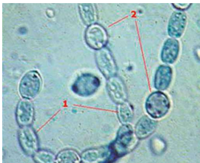
Figura 1. Cianobacteria, Anabaena azollae . 1. Células vegetativas; 2. heteroquistes.

La asociación también tiene gran importancia como sumidero potencial de carbono (C), dado que, al poseer una alta tasa relativa de crecimiento (TRC)