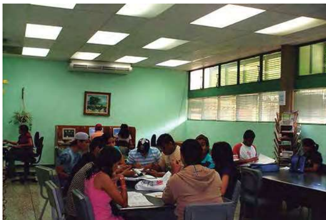
Foto 2. Usuarios en la sala de lectura y sala de computación y navegación.

Realizan actividades regulares que consisten en la valorización, actualización, y de modo general, el mejoramiento de la colección y mantienen las suscripciones a las revistas más relevantes del área agrícola para ponerla al servicio de los usuarios y de las instituciones del país.