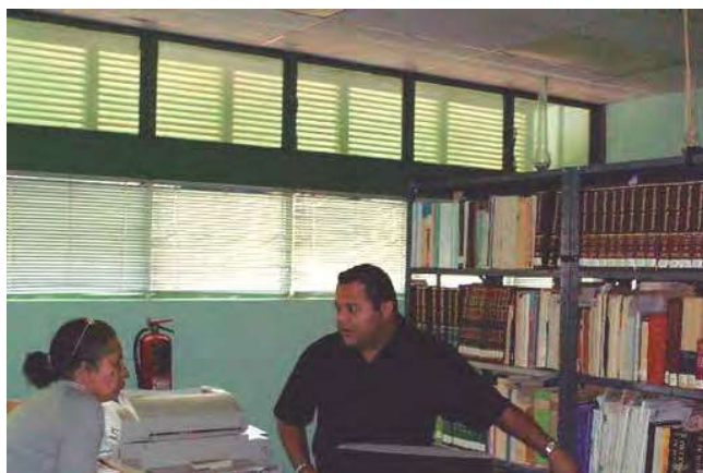
Foto 3. Usuario haciendo uso del servicio de referencia.

Se instruyen y ayudan a los usuarios a través del diálogo a encontrar y elegir aquellos materiales que estos requieren. Consiste en la asistencia personal al usuario en la búsqueda de información y a la toma de decisiones de acuerdo al caso, ya sea los propios recursos de la biblioteca o con lo que están disponible en otras organizaciones de información de la región, en el país o el extranjero.