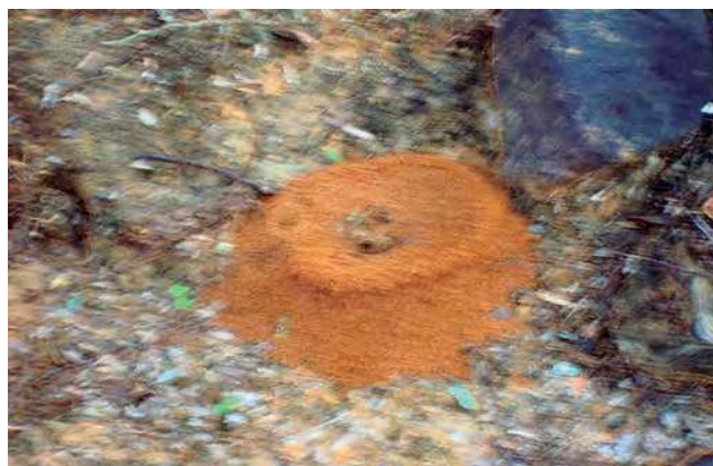
Foto 2. Las casa de las hormigas.

cuando venían pal corral sin jopealos, cuando las jormigas hacen su cueva eso dice que va a lloved, y las cabañuelas que la jasemos pocos ahorita, y naide le pone cuidao al tiempo”. Foto 2.