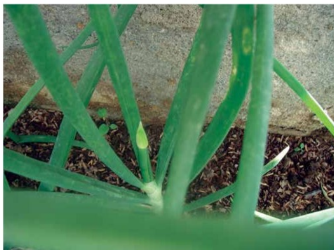
Foto 1. Inicio del crecimiento del escapo floral.

A los 30 días después de la siembra comenzó el crecimiento del escapo floral, cuando la planta tenía en promedio 8 hojas (Foto 1), el escapo en la parte apical sustenta la umbela que está protegida por una espata. El desarrollo del escapo ocurrió durante 20 días y cesó su crecimiento cuando alcanzó de 80 a 100 centímetros de longitud (Foto 2). El escapo termina en una umbela esférica compuesta por alrededor de 300 flores, cada una sostenida por un pedicelo. La floración en mayor porcentaje se encontró a los 60 días después de la siembra de los bulbos vernalizados y se evidenció por la ruptura de la espata que envolvía a la inflorescencia (Foto 3). El desarrollo de la formación de la umbela se evidencia en las Fotos 1, 2 y 3.