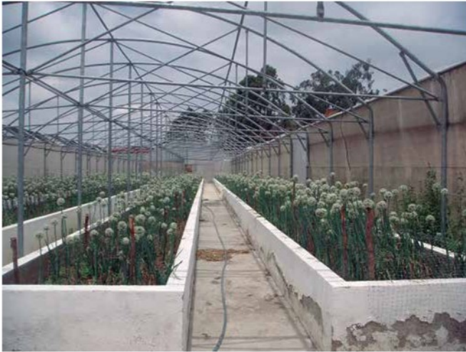
Foto 2. Final del crecimiento del escapo floral.