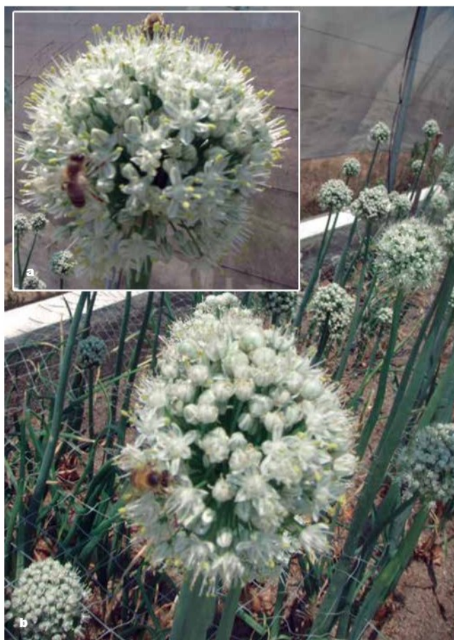
Foto 7 a y b. Abejas polinizando las flores.

En general, las flores abren de forma irregular, son vistosas y de polinización entomófila, lo que favorece la polinización cruzada. El período de inicio de la floración ocurrió entre los 30 y 60 días después de la siembra y la apertura floral duró 30 días. La producción de flores está inducida por factores genéticos y ambientales, por lo que, podemos decir que bajo las condiciones de Cubiro, estado Lara, la