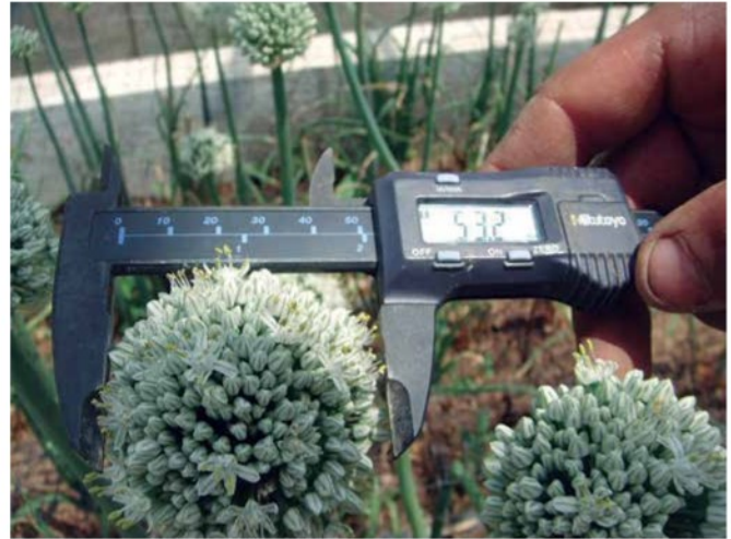
Foto 4. Tamaño de la umbela al inicio de la antesis.