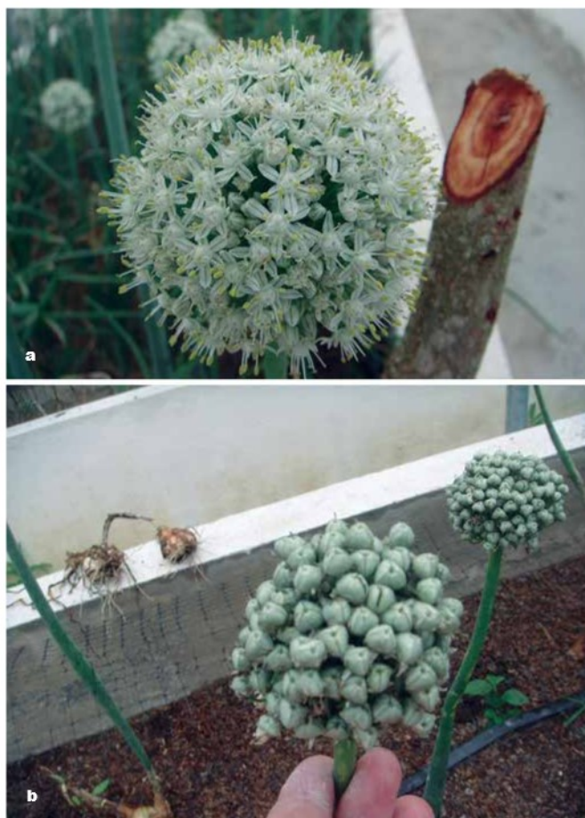
Foto 6 a y b. Pétalos, estambres y ovario trilobular de las flores.