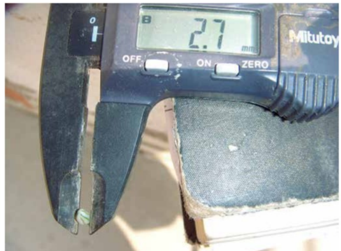
Foto 5. Tamaño del botón floral en cada umbela.

Cada bulbo produjo en promedio 3 bulbos de los cuales en promedio 2 produjeron inflorescencia. La umbela consta de unas 50 a 1.000 flores pequeñas de color blanco con estrías verdes, tiene en promedio diámetros de 53 a 54 milímetros (Foto 4). El botón floral alcanzó en promedio diámetros de 2,7 milímetros antes de la antesis (Foto 5).