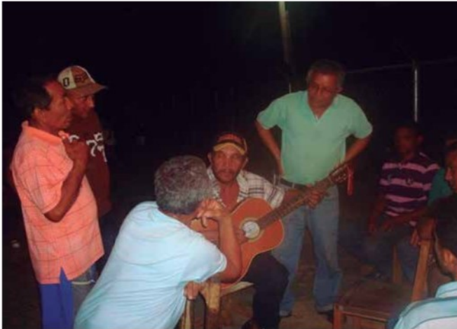
Foto 7. Conversatorio con agricultores Caserío Saladillo, parroquia Siquisique del municipio Urdaneta.

Finalmente, precisaron los acontecimientos sobre el manejo agronómico de los cultivos cuyo producto a cosechar están sobre la tierra (tomate, pimentón, cebolla, cebollín, entre otros) y bajo la tierra (papa, yuca, entre otros) y el manejo sanitario de los caprinos; ambos manejos que se suscitan en cada “Fase Lunar”.