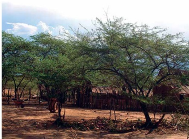
Foto 3. Caserío Saladillo, parroquia Siquisique del municipio Urdaneta.