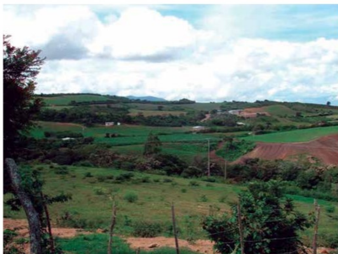
Foto 2. Vista Caserío Las Cuibas, parroquia Diego de Lozada del municipio Jiménez.