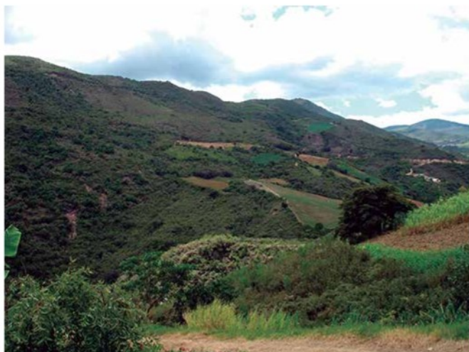
Foto 1. Vista Caserío Limoncito, parroquia Bolívar del municipio Morán.