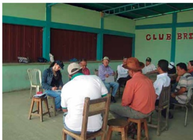
Foto 6. Conversatorio con agricultores Caserío Las Cuibas, parroquia Diego de Lozada del municipio Jiménez.