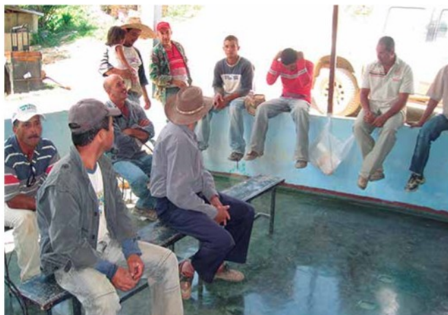
Foto 4. Conversatorio con agricultores Caserío Limoncito, parroquia Bolívar del municipio Morán.