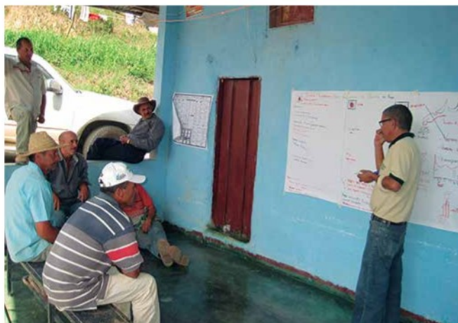
Foto 5. Conversatorio fases lunares con agricultores Caserío Limoncito, parroquia Bolívar del municipio Morán.