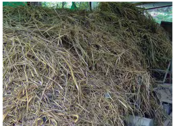
Foto 2. Pasto gamelote secado al aire libre y protegido bajo techo.

Para la cama se utilizó viruta de madera proveniente de una unidad de producción de bovinos cercana a la casa del Sr. Jiménez y pasto guinea o gamelote ( Megathyrsus maximus , antes Panicum maximus ), cosechado manualmente a orilla de carretera, luego secado al aire libre y puesto bajo techo en un área del galpón (Foto 2).