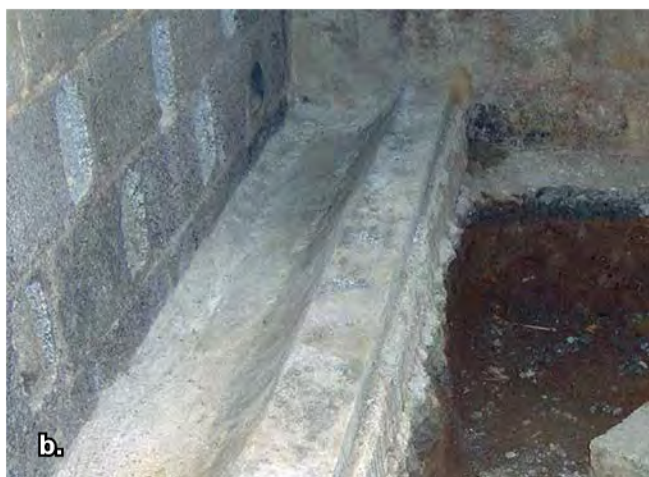
Foto 4. a. Bebedero tipo chupón, b. Comedero de concreto de una sola fila.