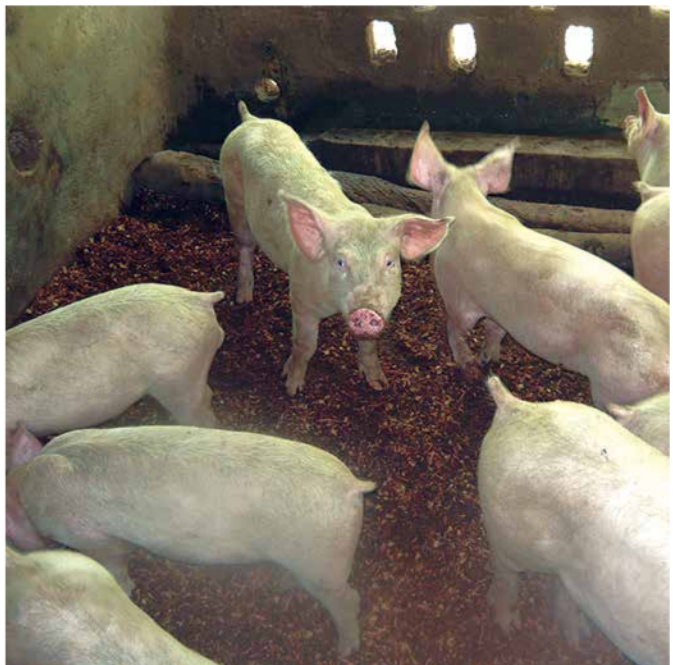
Foto 6. Condiciones de los cerdos en el corral con cama profunda.

Los parámetros productivos tales como la ganancia diaria de peso, conversión alimenticia y eficiencia alimenticia indicados en el Cuadro, dan muestra de la rentabilidad que se genera aplicando este sistema de producción, además, la mortalidad fue nula. Estos datos concuerdan con los parámetros productivos reportados a nivel nacional.