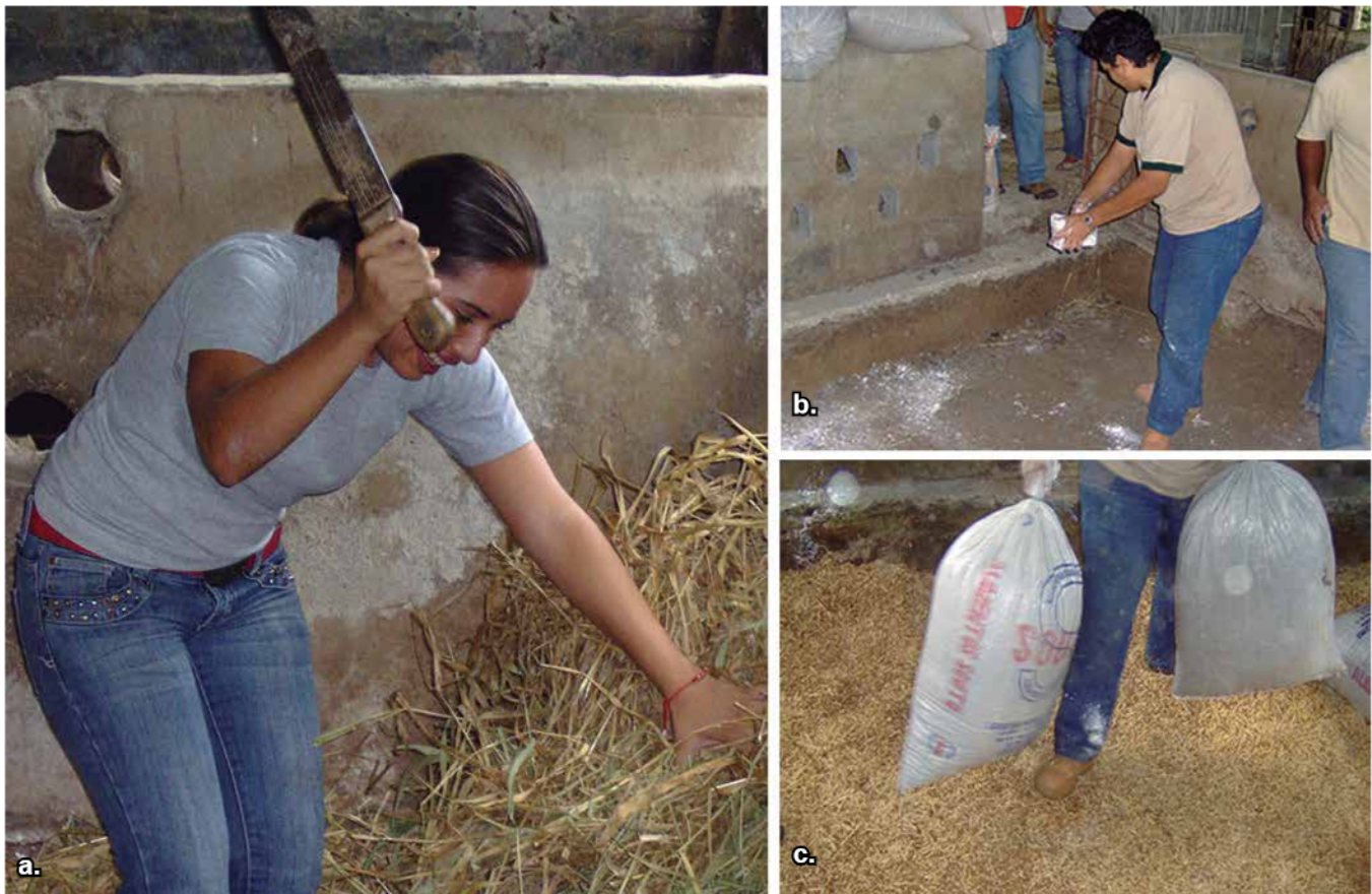
Foto 5. Incorporando el material en el corral. a. Agregando cal. b. Viruta de madera. c. Pasto gamelote.

Se agregó al corral cama fresca y seca en una proporción de 3 kilogramos de pasto/animal/ semana, especialmente en las áreas de defecación.