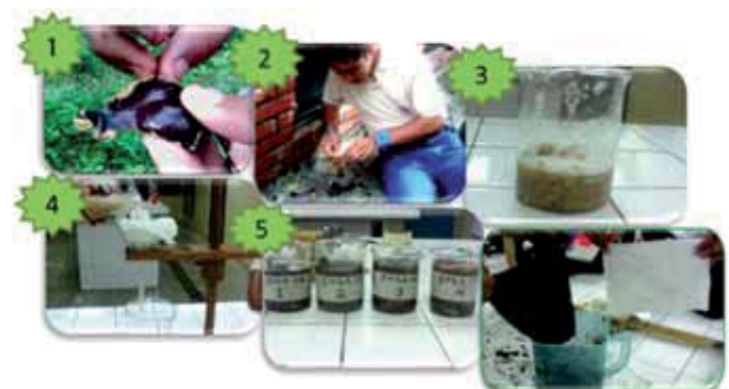
Figura 2. Composición sobre los pasos del trabajo de laboratorio.