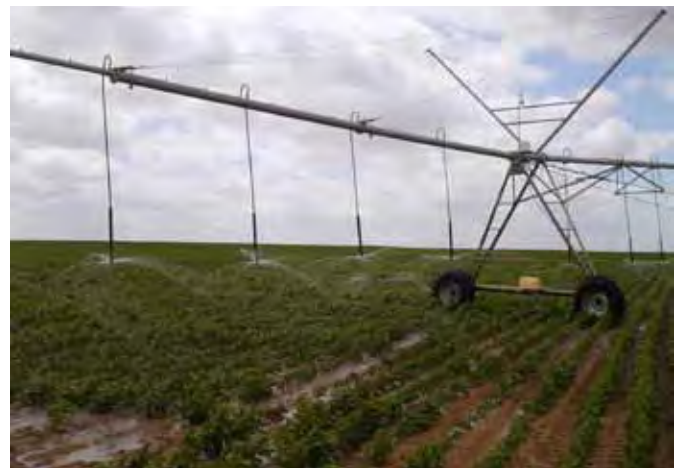
Fotos 1 y 2. Sistema de riego por pivote central ubicado en el Proyecto Agrario Socialista José Ignacio Abreu e Lima, estado Anzoátegui.