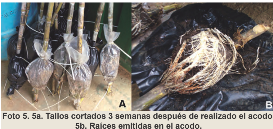
Foto 5. 5a. Tallos cortados 3 semanas después de realizado el acodo. 5b. Raíces emitidas en el acodo.