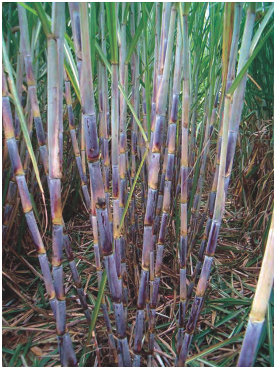
Foto 1. Cepas de caña de azúcar con tallos aptos para acodos.

Se toma una envoltura plástica (preferiblemente de calibre 30), para facilitar el manejo del mismo al momento de hacer el acodo, debe tener dimensiones aproximadas de 45 centímetros de ancho por 55 centímetros de largo para cada acodo y se enrolla en el tallo a una altura aproximada de 20 a 30 centímetros desde la base; sujetándola con las cintas de amarre o tirraje ( cada acodo lleva 2 cintas ), tratando de cubrir de 2 a 3 nudos. (fotos 2a y 2b).