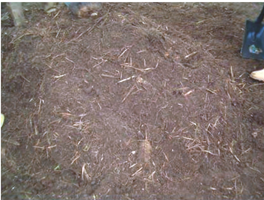
Foto 4. Sustrato utilizado para la realización de acodos en ELY.