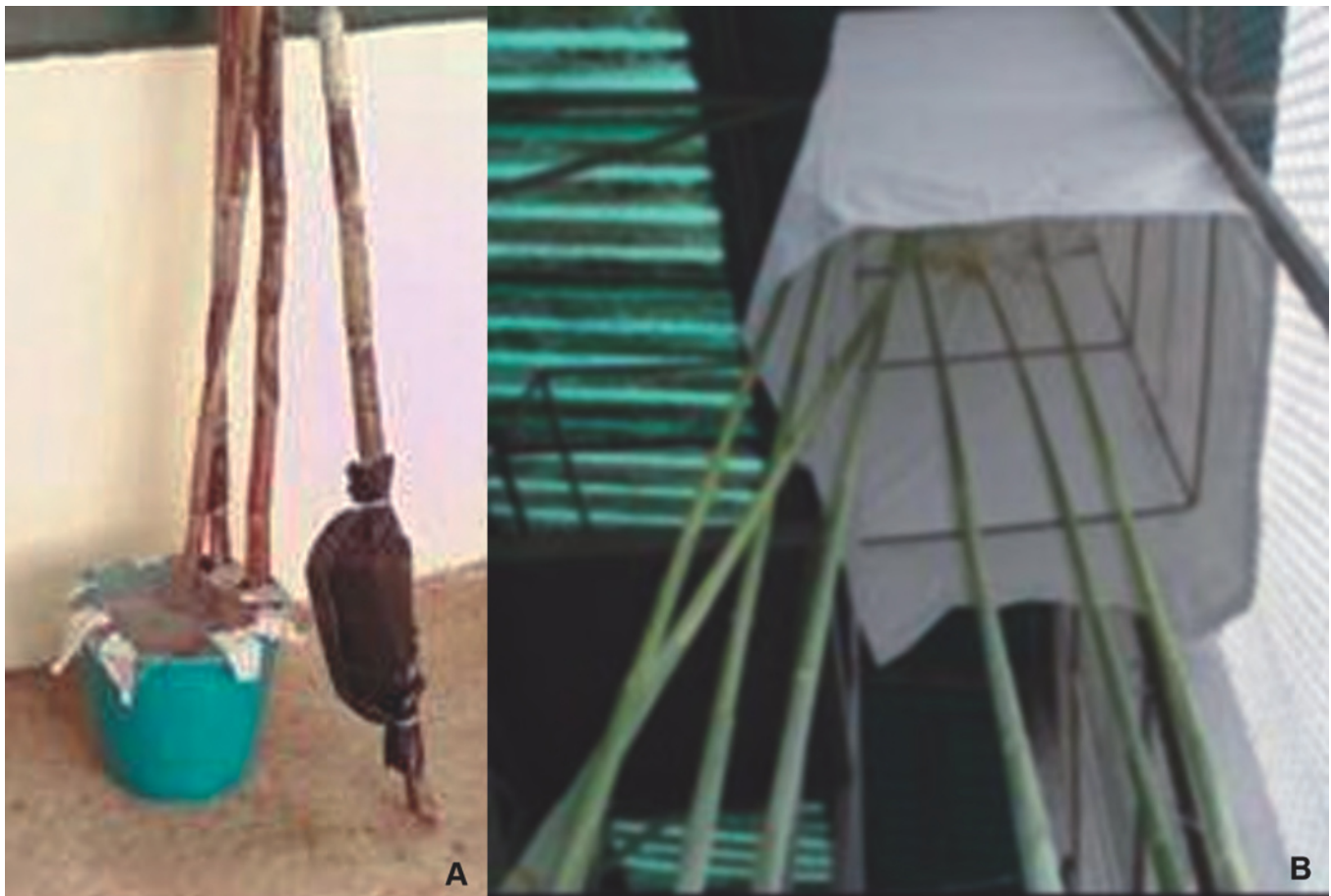
Foto 6. 6a. Vista de un tallo con acodo durante el cruce biparental. 6b. Cruce de las inflorescencias en la casa de cruzamiento.