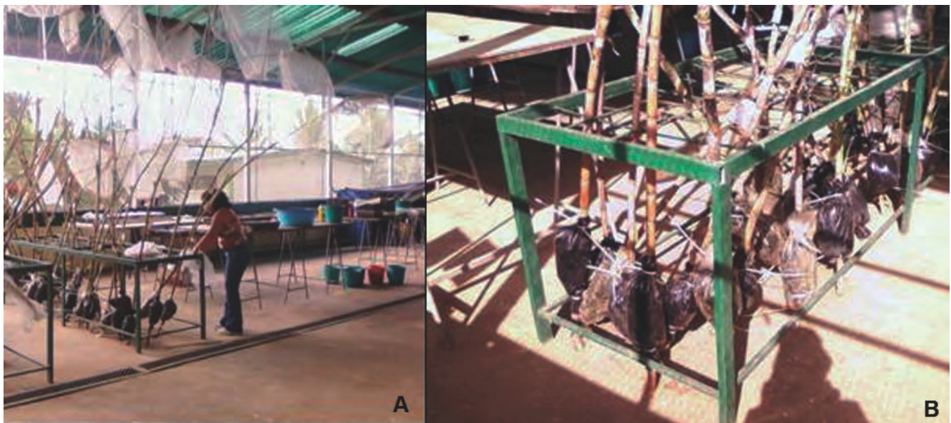
Foto 7. 7a. Tallo con acodo durante el proceso de maduración de las semillas. 7b. Detalle del acodo en el tallo durante el proceso de maduración de semillas.